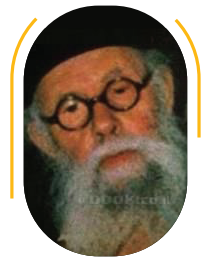
חכם עלוואן שמעון אבידני

חכם עלוואן שמעון אבידני, חיבר את הספר "מעשה הגדולים" דרשות וסיפורים על פרשות השבוע, תרגם את התנ"ך לכורדית, כתב פיוטים וחיבר פרוש לספר הזוהר 'קרבנין ועלוון'.