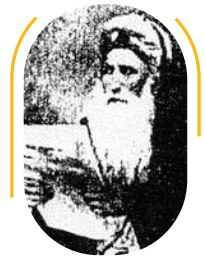
חכם רפאל מאיר פאניז'ל

חכם רפאל מאיר פאניז'ל נפטר בי"ד טבת תרנ"ג (1893) ונקבר בהר הזיתים.