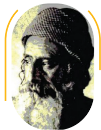
חכם מארי יחיא יצחק הלוי

חכם יחיא יצחק הלוי נפטר ביום י"א בסיוון תרצ"ב (1932) מנוחתו כבוד בצנעא.