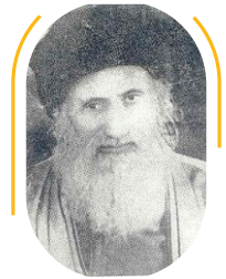
חכם מולא מתתיה גרג'י

חכם מולא מתתיה גרג'י נפטר בי"ד בכסלו תרע"ח (1918) בהיותו בן 70 ונטמן במערב הר הזיתים.